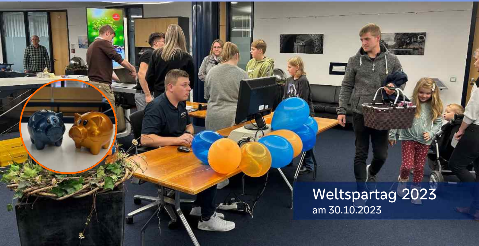
Weltspartag 2023 am 30.10.2023