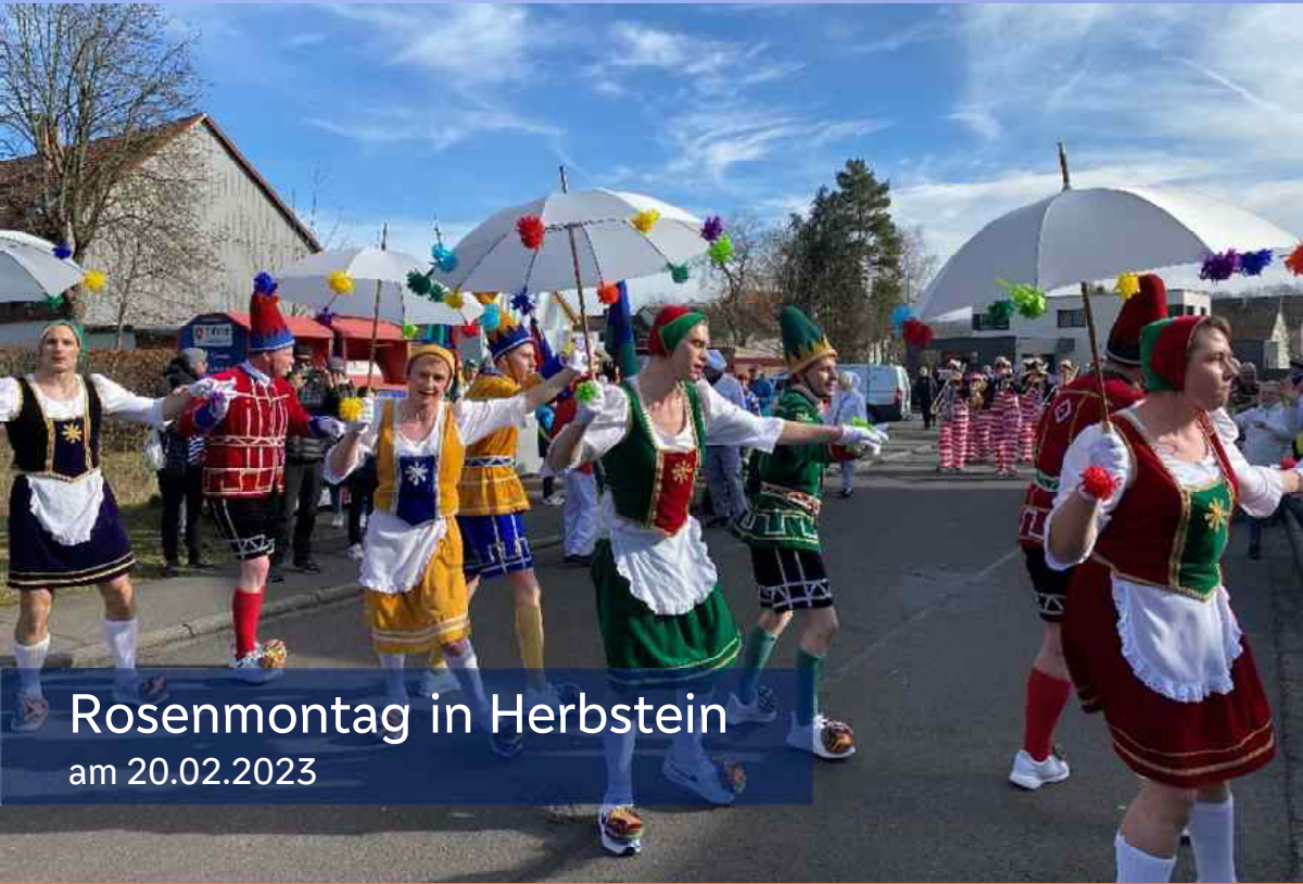
Rosenmontag in Herbstein am 20.02.2023