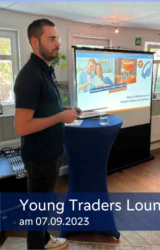
Young Traders Lounge 1.0 am 07.09.2023