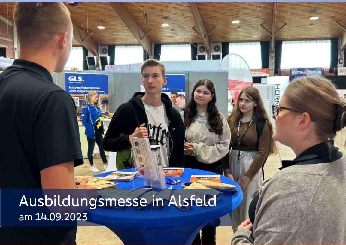
Ausbildungsmesse in Alsfeld am 14.09.2023