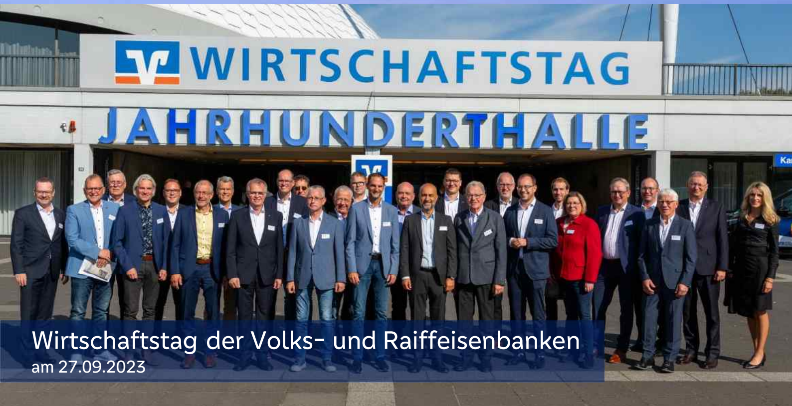
Wirtschaftstag der Volks- und Raiffeisenbanken am 27.09.2023