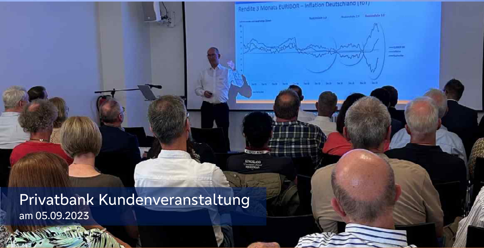
Privatbank Kundenveranstaltung am 05.09.2023