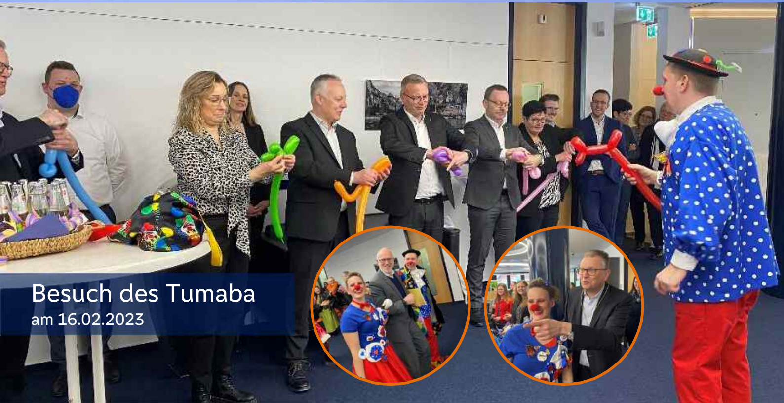
Besuch des Tumaba am 16.02.2023