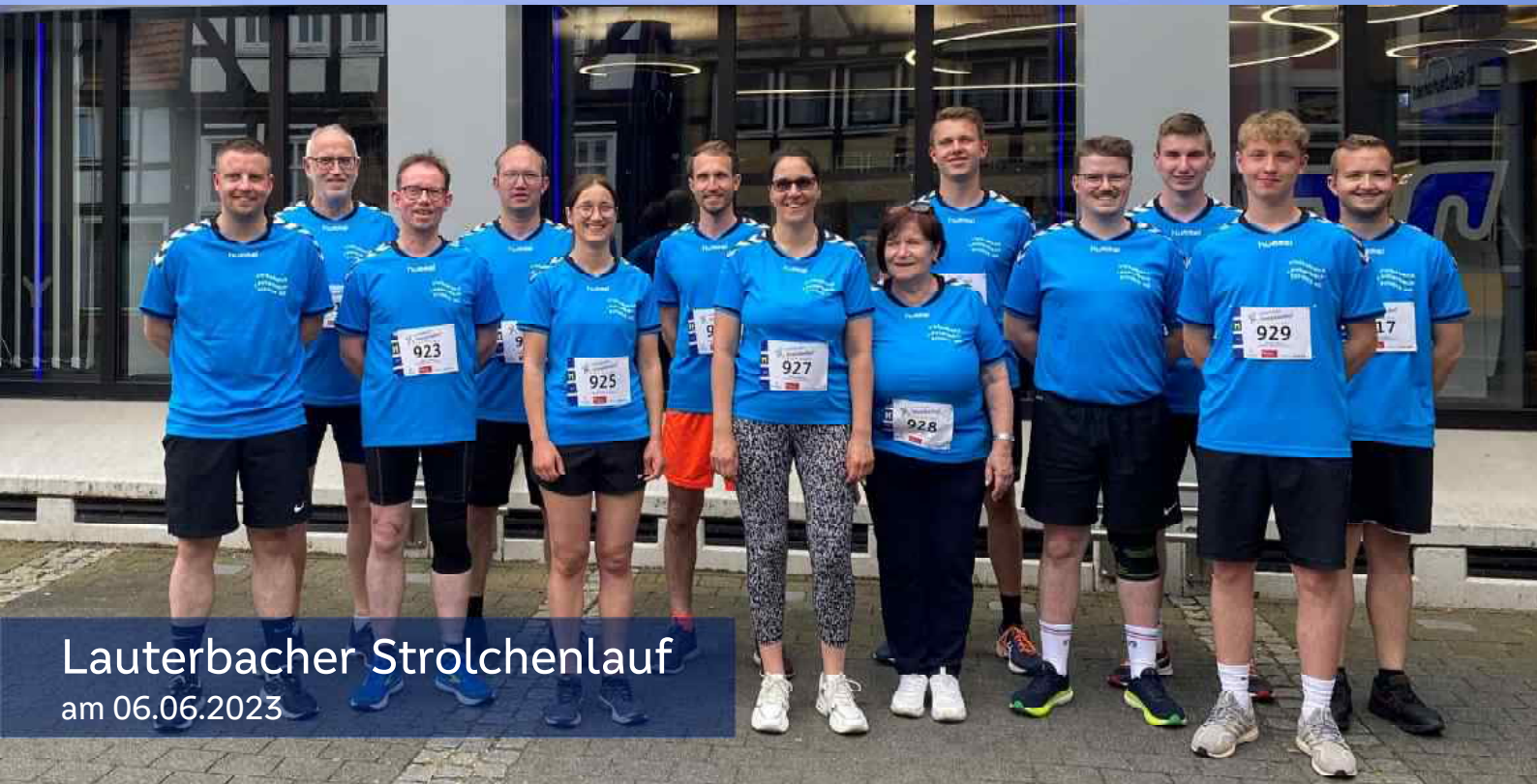
Lauterbacher Strolchenlauf am 06.06.2023