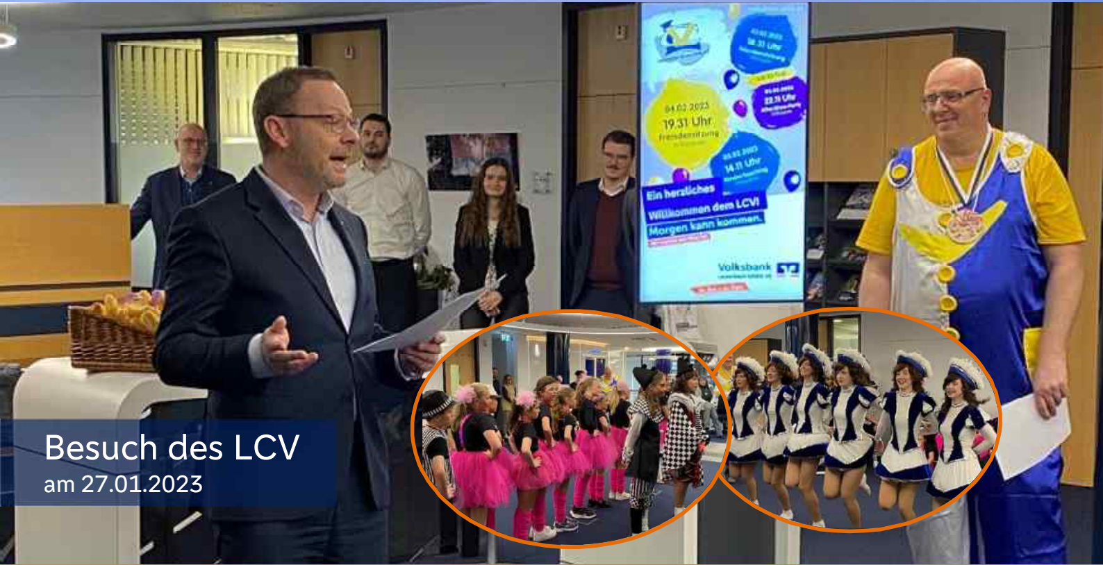
Besuch des LCV am 27.01.2023