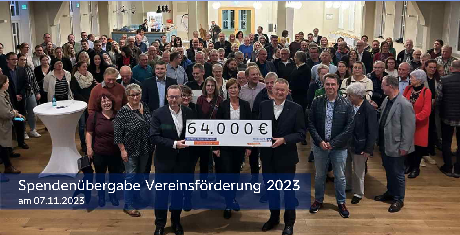
Spendenübergabe Vereinsförderung 2023 am 07.11.2023