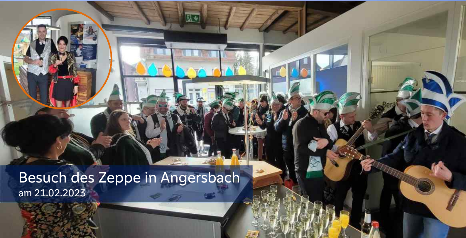
Besuch des Zeppe in Angersbach am 21.02.2023