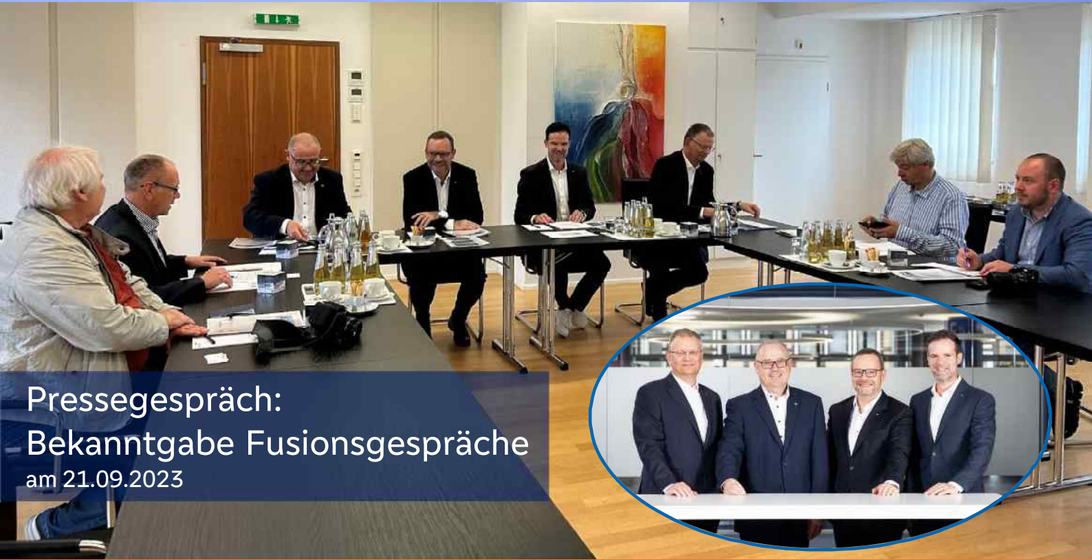
Pressegespräch: Bekanntgabe Fusionsgespräche am 21.09.2023