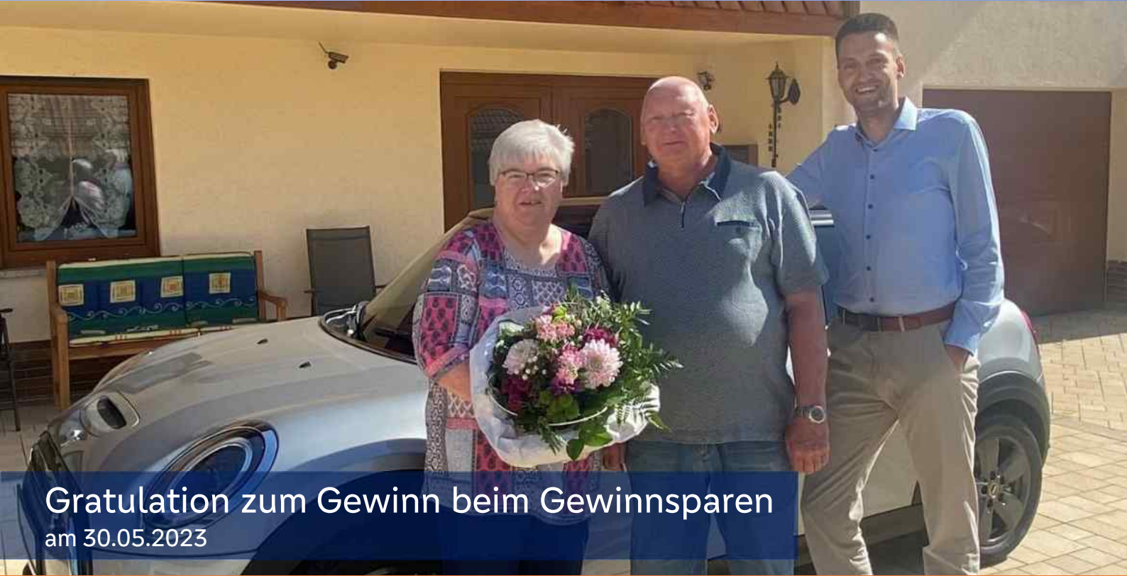
Gratulation zum Gewinn beim Gewinnsparen am 30.05.2023