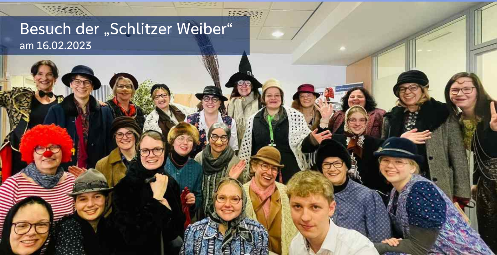
Besuch der „Schlitzer Weiber“ am 16.02.2023