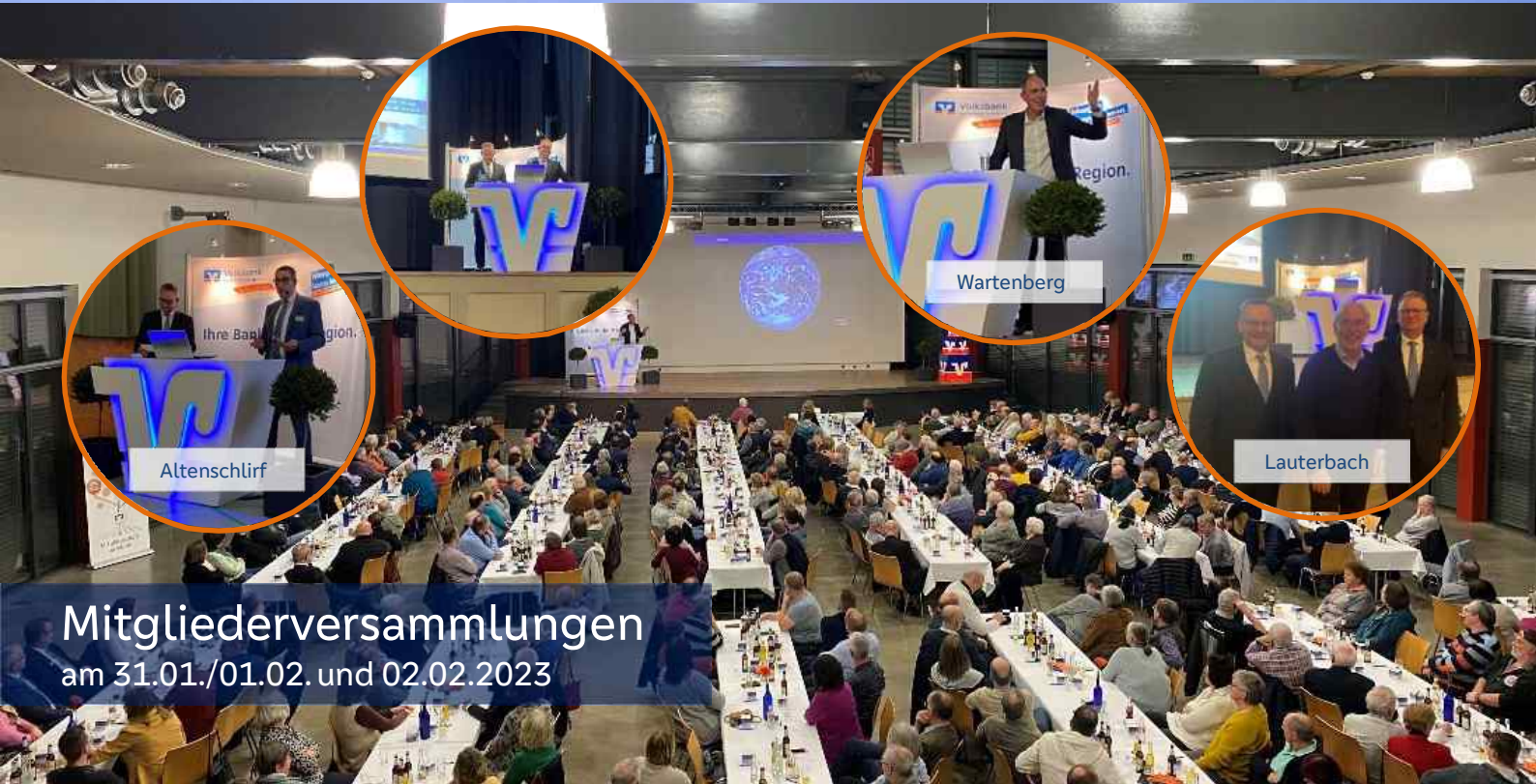
Mitgliederversammlungen am 31.01./01.02. und 02.02.2023